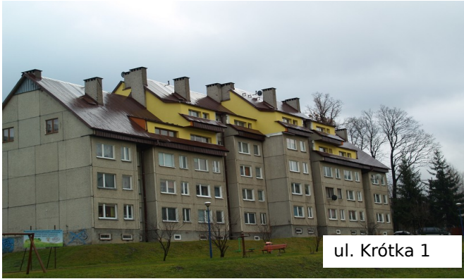
ul. Krótka 1