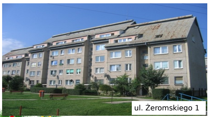
ul. Żeromskiego 1