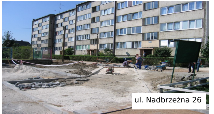
ul. Nadbrzeźna 26