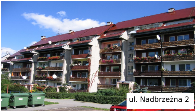
ul. Nadbrzeźna 2