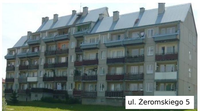
ul. Żeromskiego 5