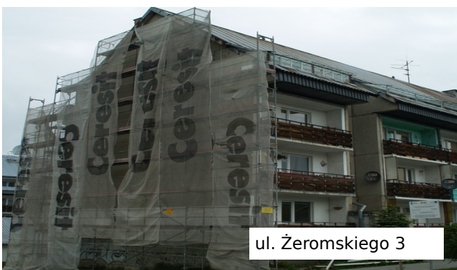
ul. Żeromskiego 3