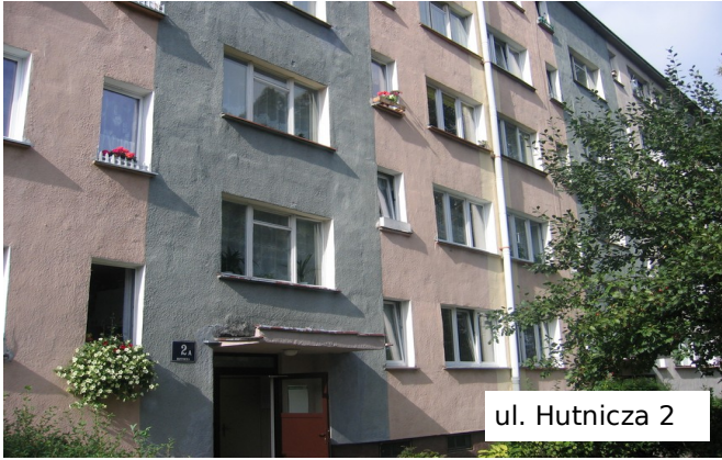
ul. Hutnicza 2