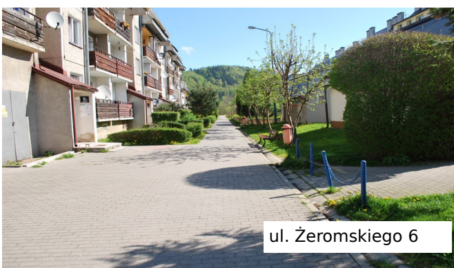
ul. Żeromskiego 6