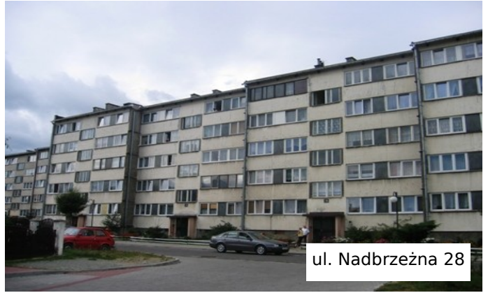
ul. Nadbrzeźna 28