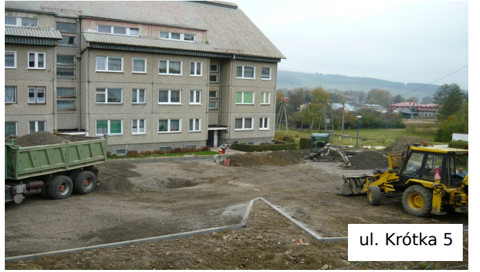
ul. Krótka 5