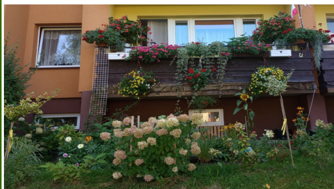
Ul. Krótka 5B