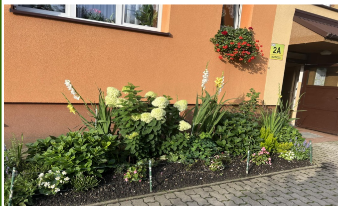
Ul. Hutnicza 2A