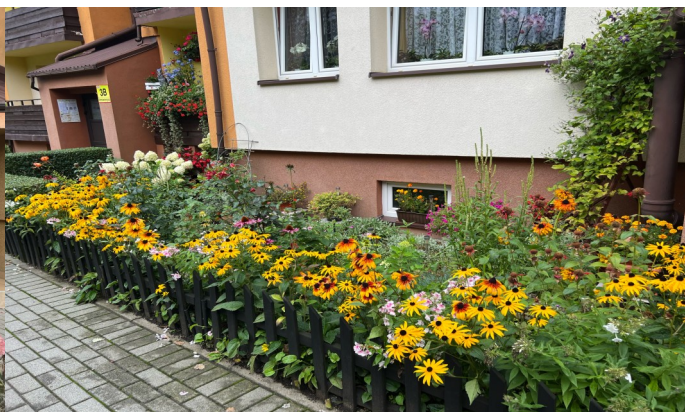
Ul. Żeromskiego 3B