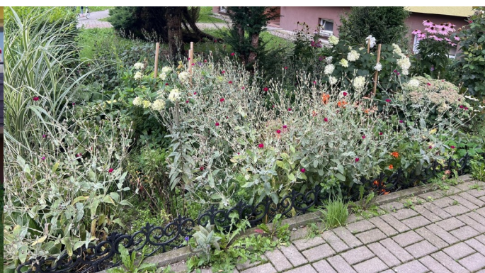
Ul. Krótka 5B