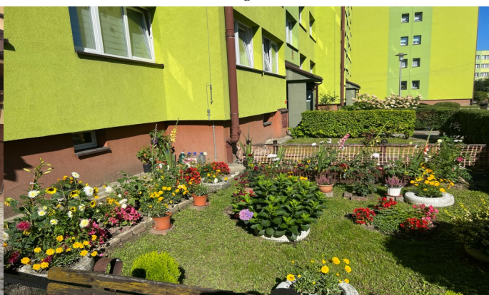
Ul. Nabrzeźna 26