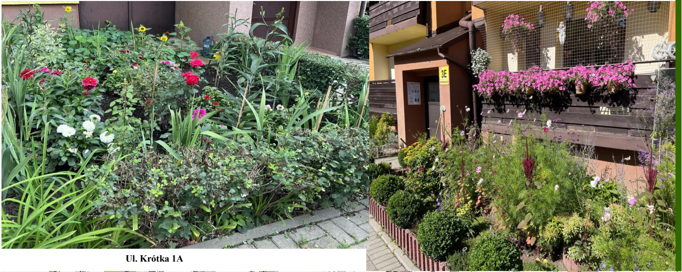
Ul. Krótka 1A