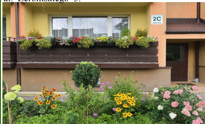
Ul. Krótka 2C